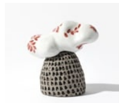
Beatriz Trepap