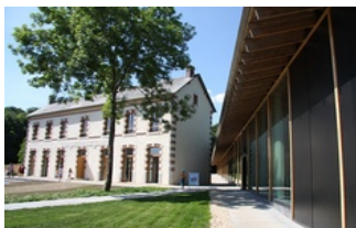
CCC La Borne