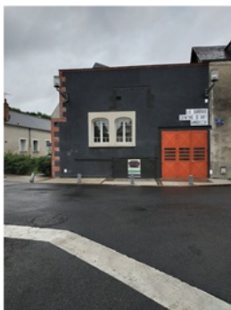
Centre d'art Le Garage

17h-18h : Visite de l'exposition au Garage