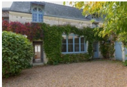
Maison Max Ernst