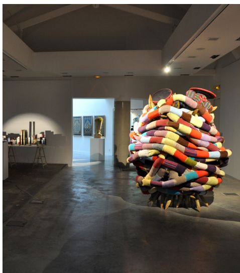
Centre d'art l'ar[T]senal

*(Réservation indispensable avant le 10 janvier sur le formulaire d'inscription en ligne.)